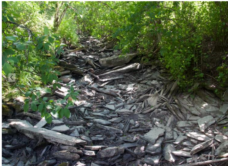
Rester etter Monagruva

I dag er gruva totalt gjengrodd, men hele bekkeleie er fullt opp av skiferstein etter produksjonen.